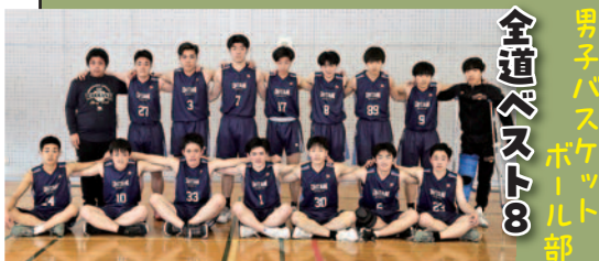
男子バスケットボール部 全道ベスト8