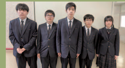
ボランティア部 人との繋がりを大切にします。