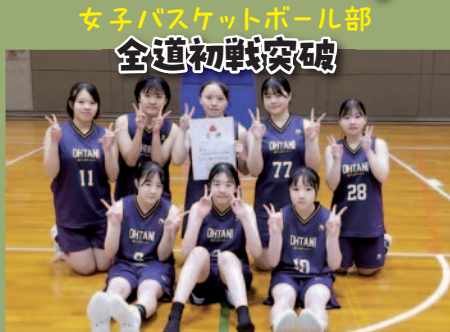
女子バスケットボール部 全道初戦突破