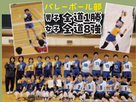
バレーボール部 男子全道1勝 女子全道8強