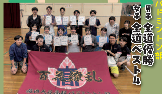
男子全道優勝 女子全道ベスト4 バドミントン部