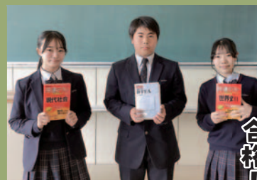
大谷塾 第一志望合格!