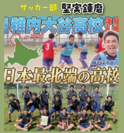
サッカー部 堅実錬磨