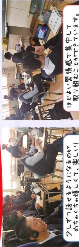
少しずつ話せるようになるのがめっちゃくちゃ嬉しくて、楽しい!(2年男子)